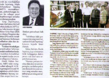
400 Bendera akan menghiasi kawasan sekitar bandar Taiping